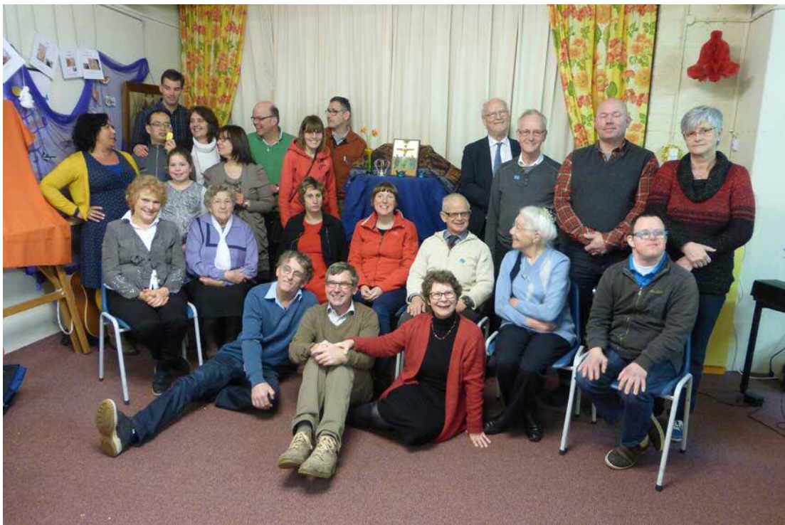
Gemeenschap 'De Koningskinderen'

Kom gerust naar een bijeenkomst: u bent van harte welkom!